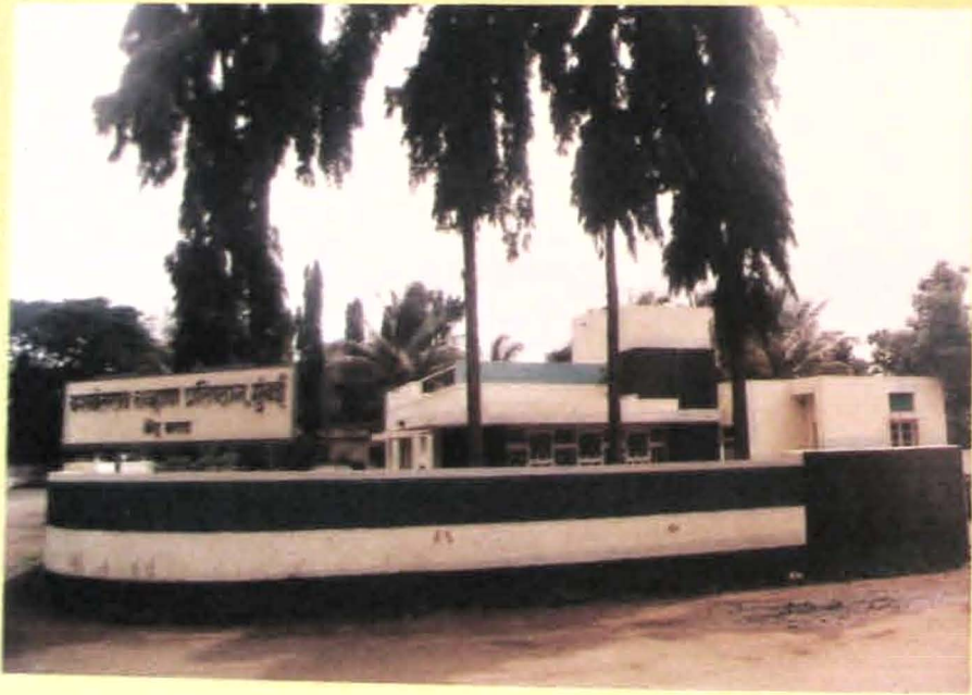
यशवंतराव चव्हाण यांचे निवासस्थान 'विरंगुळा' कराड.