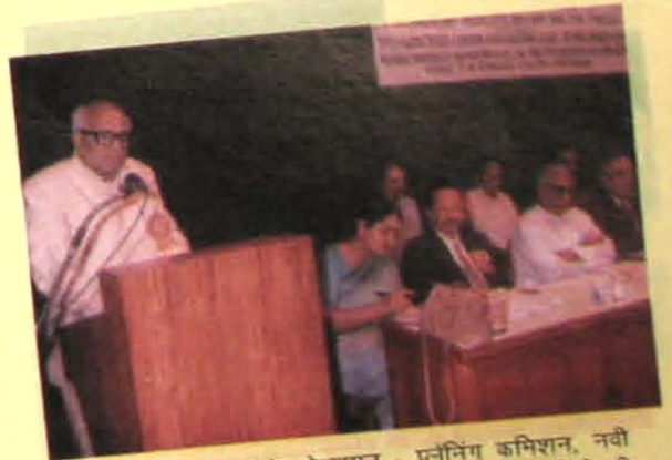
मा. श्री. मधु दंडवते, चेअरमन - प्लेनिंग कमिशन, नवी दिल्ली हे "सिपोईझम, पार्लमेंटरी प्रोसेसजनस, ज्युडीशियरी अॅण्ड दि प्रेस" कार्यक्रमात सहभागी झाले असताना.