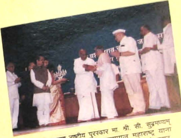
यशवंतराव चव्हाण राष्ट्रीय पुरस्कार मा. श्री. सी. सुब्रमण्यम् माजी केंद्रीय मंत्री व माजी राज्यपाल महाराष्ट्र यांना तत्कालीन पंतप्रधान मान. श्री. देवे गौडा यांचे हस्ते प्रदान.