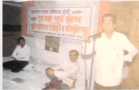
पद्मश्री दया पवार स्मृती संमेलन साहित्यविषयक चर्चासत्र व कविसंमेलनात बोलताना ज्येष्ठ कविवर्य मा.नारायण सुर्वे