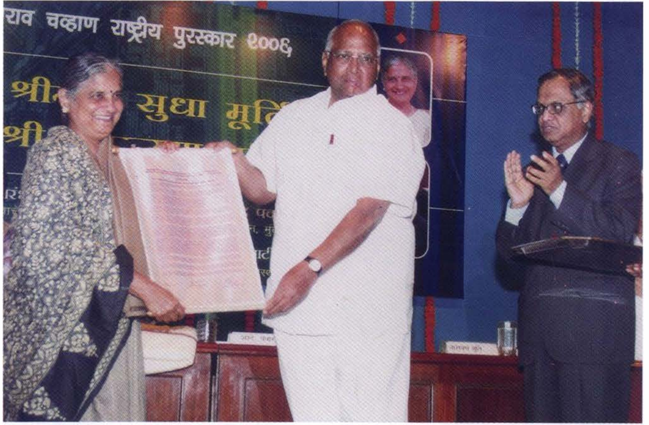
यशवंतराव चव्हाण राष्ट्रीय पुरस्कार मा.श्री.शरदराव पवार,केंद्रीय कृषीमंत्री यांच्या हस्ते स्वीकारतांना मा.श्रीमती सुधा मूर्ति सोबत मा.श्री.नारायण मूर्ति.