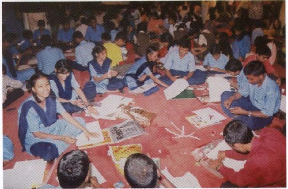
सृजन कार्यशाळेत कागदी शिल्पकला/ तयार करीत असताना सहभागी विद्यार्थी