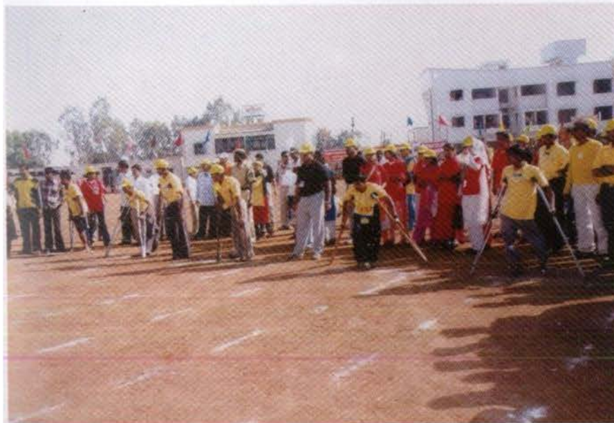
विभागीय केंद्र नाशिकने आयोजित केलेल्या येथे राज्यस्तरीय अपंग मुला-मुलींच्या क्रीडा स्पर्धेतील स्पर्धक.