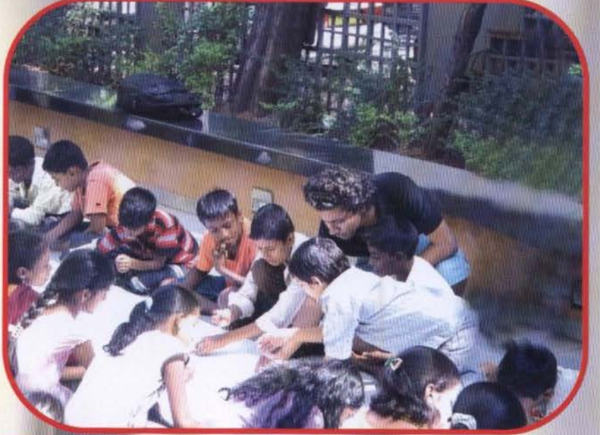
सृजन कार्यशाळेत कार्यरत असलेले विद्यार्थी.