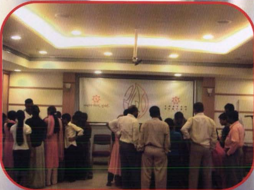
सृजन कार्यशाळेत ग्रुप कलाकृती दाखवितांना प्रशिक्षक.