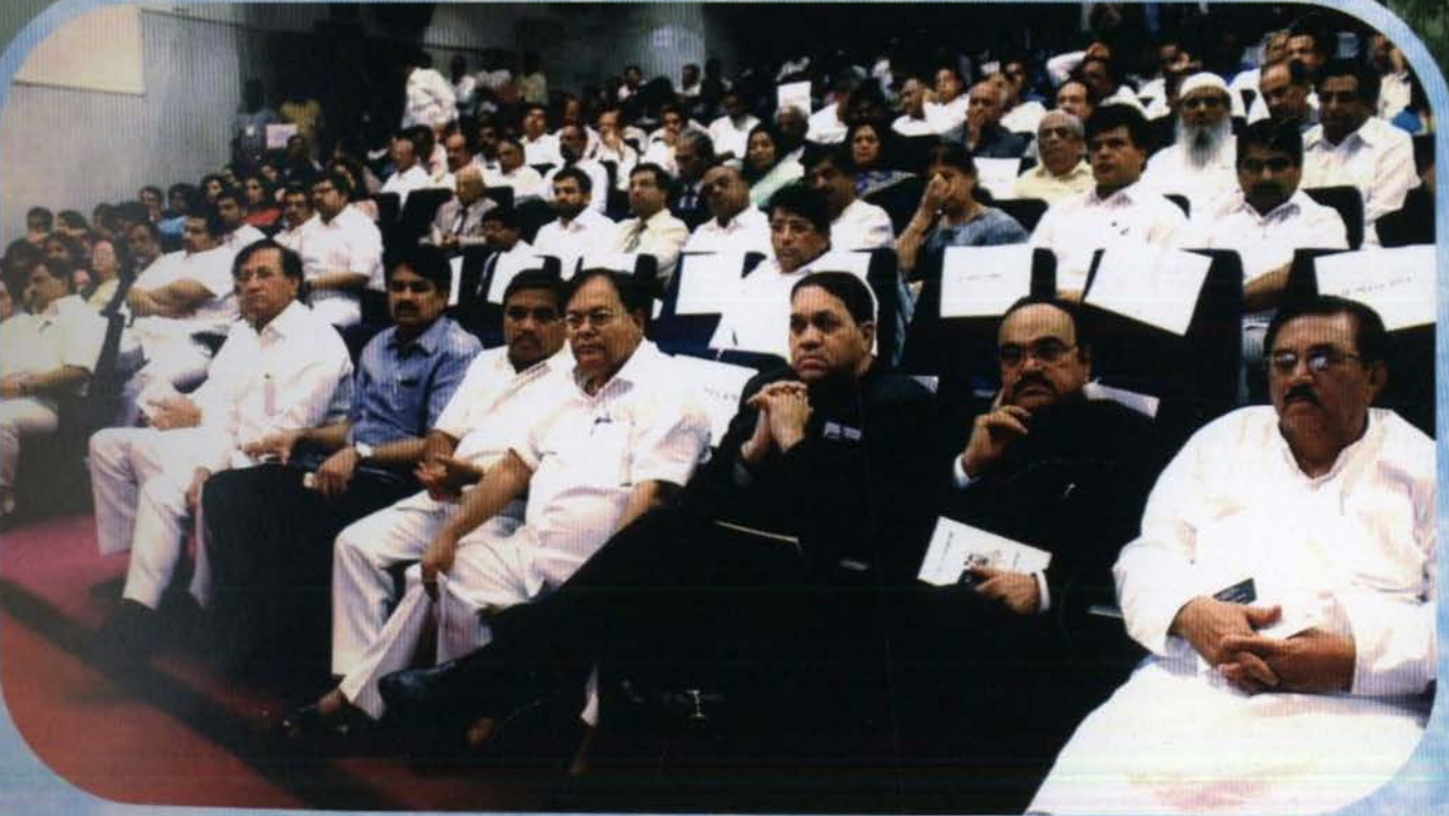
मा. यशवंतराव चव्हाण यांच्या स्मृतिप्रीत्यर्थ विशेष टपाल तिकिटाच्या उद्घाटन प्रसंगी उपस्थित महाराष्ट्र राज्याचे मा. मंत्री, मा. खासदार, मा. आमदार व प्रतिष्ठानचे मा. विश्वस्त व मा. सदस्य.