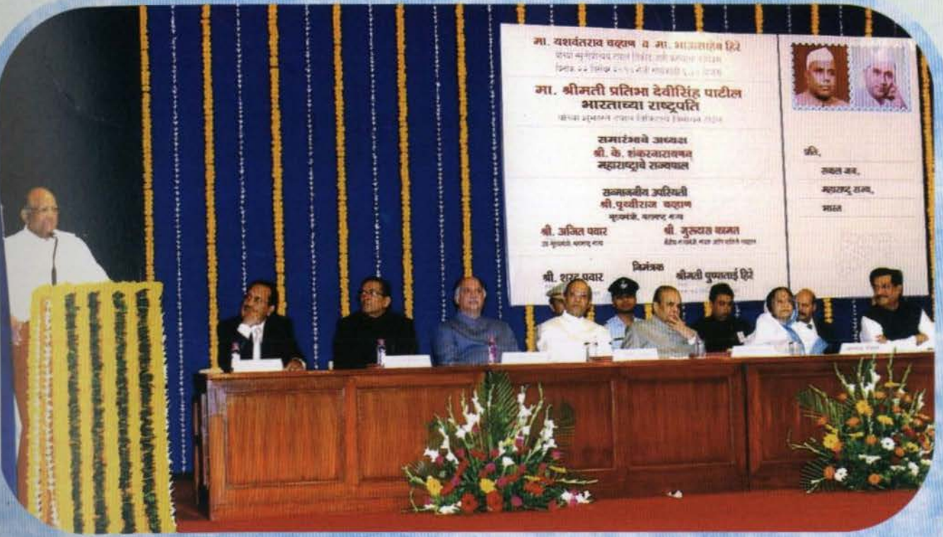
मा. यशवंतराव चव्हाण यांच्या स्मृतिप्रीत्यर्थ विशेष टपाल तिकिटाच्या उद्घाटन प्रसंगी भाषण करताना, मा. श्री. शरद पवार, केंद्रीय कृषिमंत्री व अध्यक्ष यशवंतराव चव्हाण प्रतिष्ठान, मुंबई.