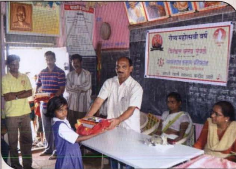
नवमहाराष्ट्र युवा अभियान व पिनेकल क्लब यांच्या वतीने आयोजित केलेला सत्कार समारंभ.