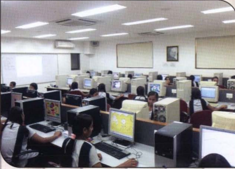
यशवंतराव चव्हाण माहिती तंत्रज्ञान प्रबोधिनी केंद्रात प्रशिक्षण घेताना विद्यार्थी.