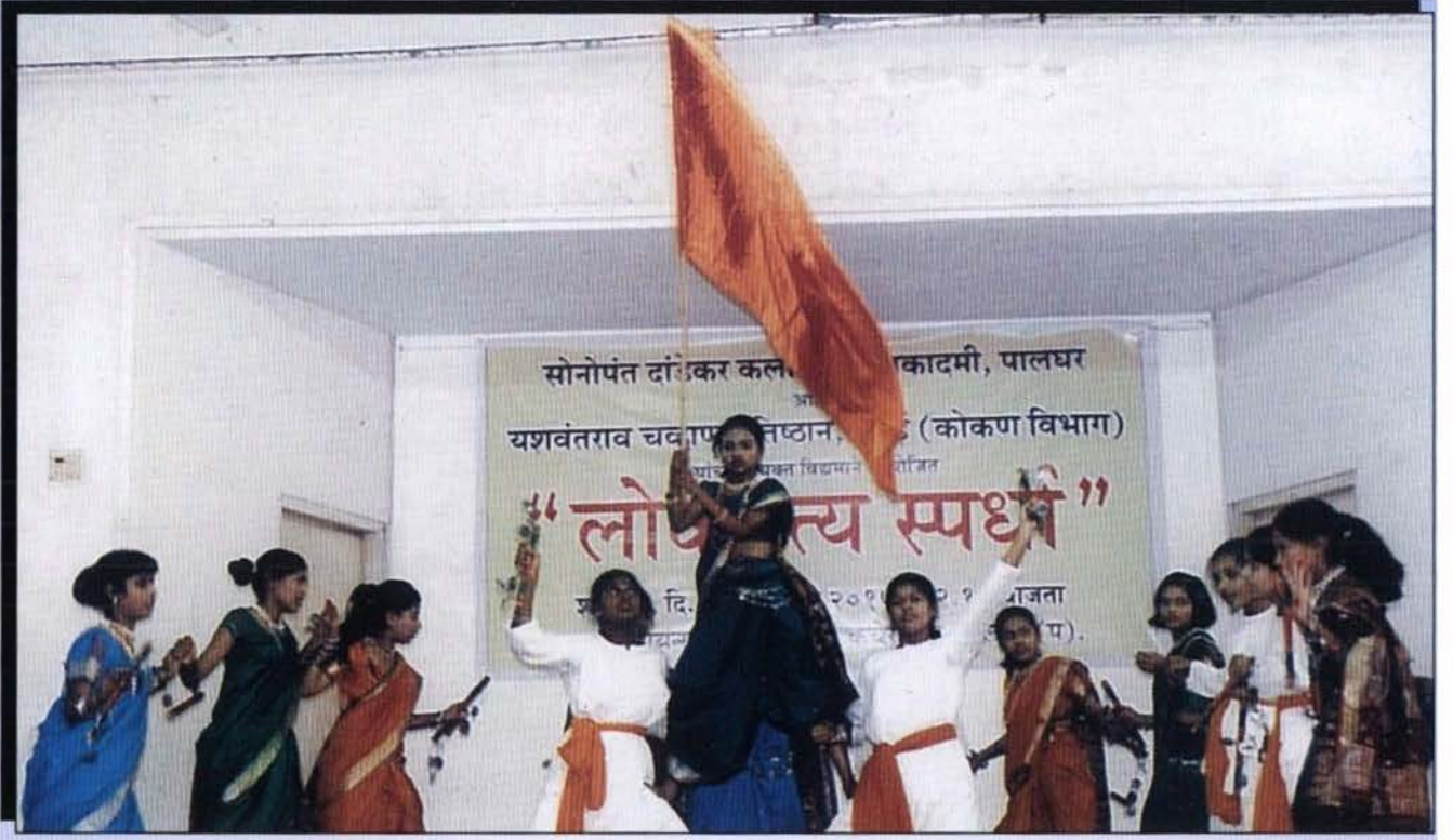
विभागीय केंद्र कोकणच्या वतीने आयोजित लोकनृत्य स्पर्धेतील कलाविष्कार सादर करताना, विद्यार्थी.