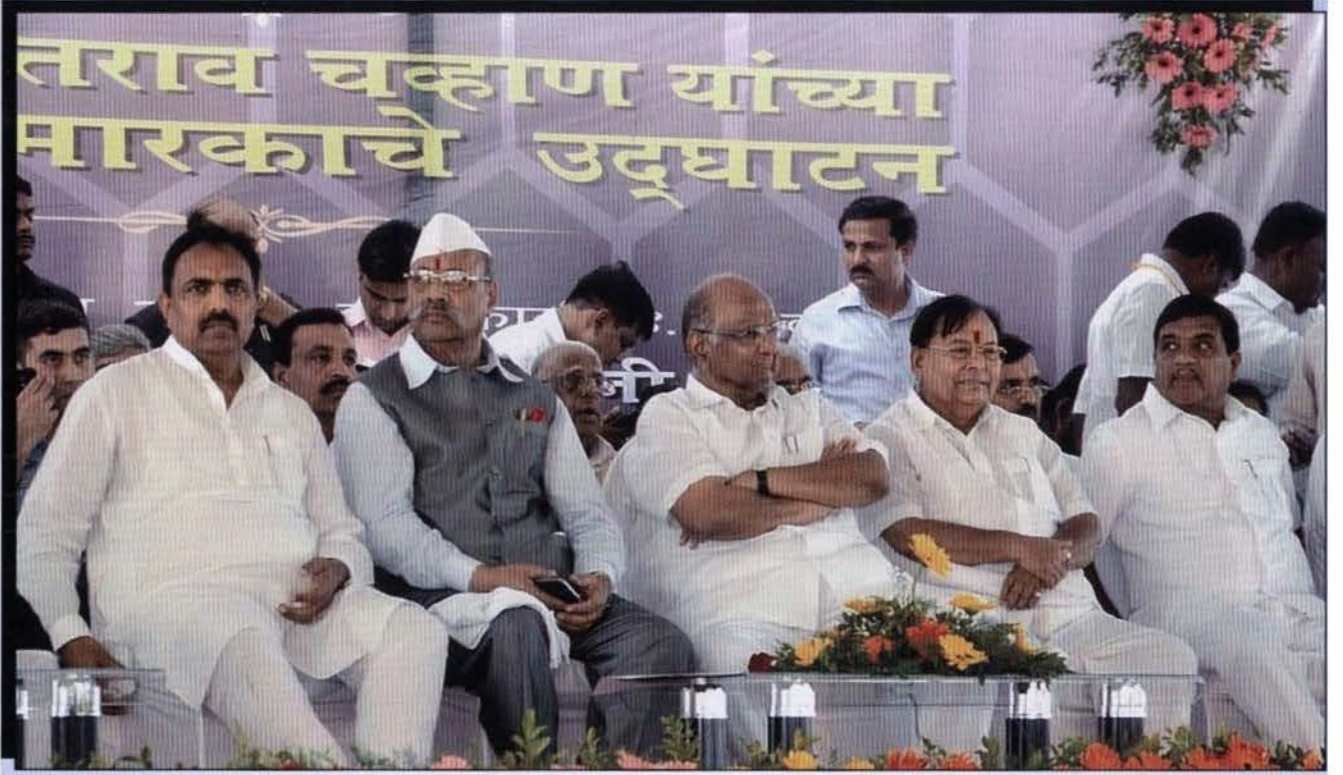
मा. यशवंतराव चव्हाण यांच्या देवराष्ट्रे, जिल्हा सांगली येथील जन्मघराच्या उद्घाटन समारंभ प्रसंगी डावीकडून ग्रामविकास मंत्री श्री. जयंतराव पाटील, सिक्कीमचे राज्यपाल श्री. श्रीनिवास पाटील, प्रतिष्ठानचे अध्यक्ष मा. श्री. शरदराव पवार, वने व पुनर्वसन मंत्री डॉ. पतंगराव कदम, गृहमंत्री श्री. आर. आर. पाटील.